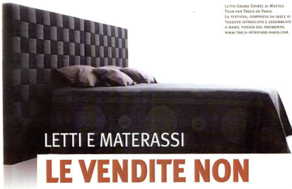
LETTO GRAND SOIRÉE DI MATTEO THUN PER TRECA DE PARIS. LA TESTIERA, COMPOSTA DA FASCE DI TESSUTO INTRECCIATE E ASSEMBLATE A MANO, POGGIA SUL PAVIMENTO. WWW.TRECA-INTERIORS-PARIS.COM