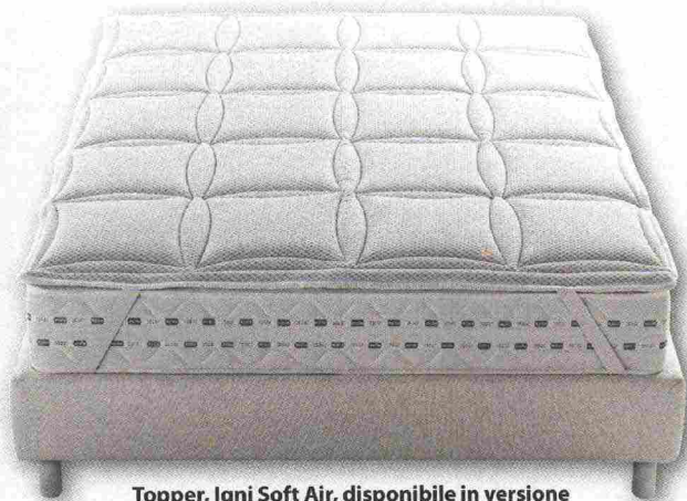
Topper, Igny Soft Air, disponibile in versione da 3 e da 5 cm di altezza

I topper Igny Soft Air sono realizzati in jersey stretch di poliestere con trattamento Insecta/Bed-Bugs. Disponibili anche i topper della linea Igny Memory, Igny Idro, Igny Basic e Igny Cotton.